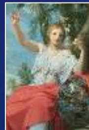
Uranie : L'astronomie