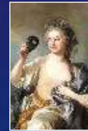
Thalie : La comédie