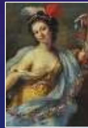
Terpsichore : La danse