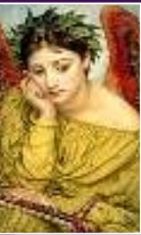
Érato : La poésie lyrique