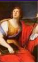
Polymnie : L'art d'écrire et la pantomime