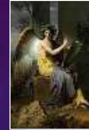
Clio : L'histoire