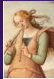
Euterpe : La musique