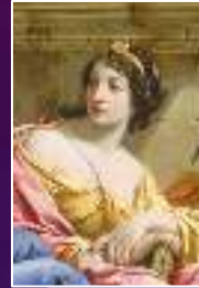
Calliope : La poésie épique

Dans l'antiquité, les arts étaient symbolisés par les muses au nombre de 9. Elles sont associées à Apollon, dieu de la musique, dont elles constituent le chœur :