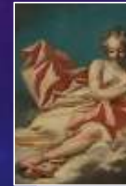
Melpomène : La tragédie