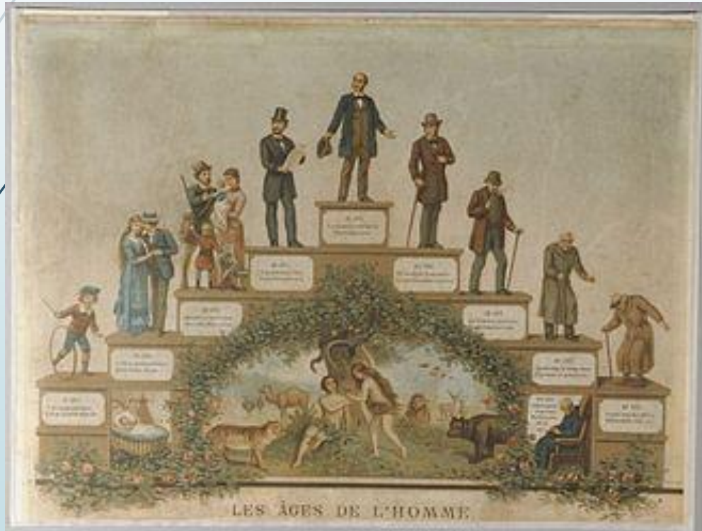
Chromolithographie représentant les âges de l'homme