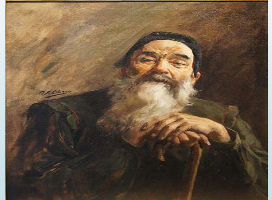
Ulpiano Checa, Personne âgée