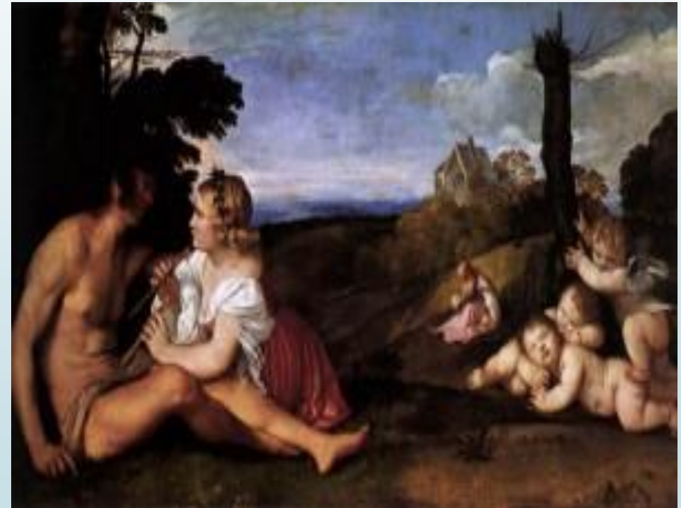
Titien, les âges de l'homme