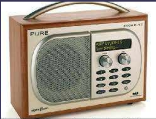
La radio numérique : présentation et caractéristiques