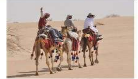
الحيوانات : الجمل و الحصان و الحمار